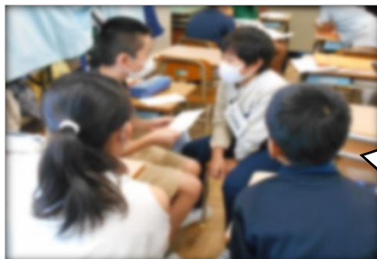
【聞いて、アドバイスを伝える様子】