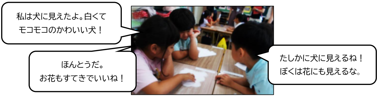
【 はさみで切ってできた紙の形が 何に見えるかを見立てている様子 】